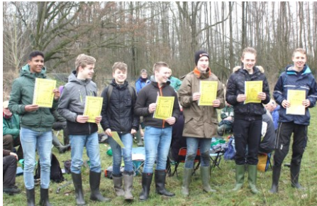
← Geslaagde MaS'ers (2018-2019) met hun EnHOe-getuigschrift